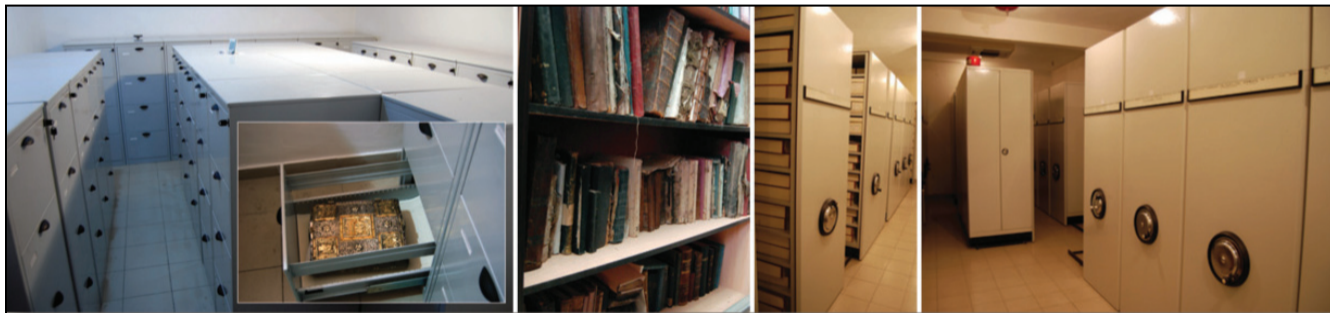
Εσωτερική άποψη του ΚΑΑΚ

Τα εδάφη, στα οποία εκτείνεται σήμερα η αλβανική επικράτεια, ανήκαν κατά την αρχαιότητα είτε στο βασίλειο της Ιλλυρίας (βόρεια), είτε στο βασίλειο της Ηπείρου (νότια).