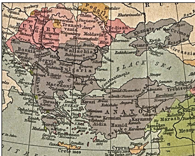
Η Οθωμανική Αυτοκρατορία κατά το 1481-1683

γιαυτό ήταν όλοι γραμμένοι γράμμα προς γράμμα με το χέρι και το καλάμρι, στο Βυζάντιο, αλλά και σε πολλά μεταβυζαντινά μοναστήρια, υπήρχαν «συνεργεία αντιγραφών», που όχι μόνον έγραφαν τα χειρόγραφα, αλλά και τα φιλοτεχνούσαν. Γιατί τότε κάθε κώδικας έπρεπε να είναι ένα έργο τέχνης: στην καλλιγραφία, στην ορθογραφία, στη διακόσμηση, στην στάχωση (= βιβλιοδεσία), στην πολυ-