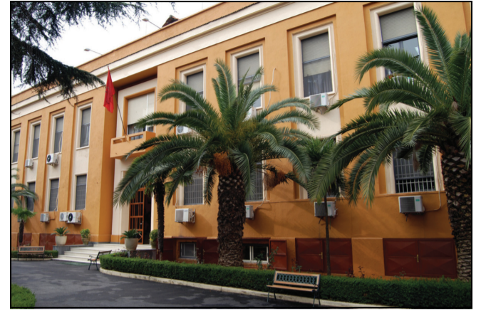
Το κτίριο που στεγάζονται τα Κεντρικά Αρχεία του Αλβανικού Κράτους ( ΚΑΑΚ)

Στις αρχές του 20ου αιώνα, με τον ξεσηκωμό των βαλκανικών λαών, δημιουργήθηκε το πρώτο ιστορικά αλβανικό Κράτος (1912) σε εδάφη-προγεφυρώματα, προ του στενού του Οτράντο - ενός θαλάσσιου στενού, που γεφύρωνε τα δρομολόγια Ανατολής και Δύσης, Ιταλίας-Βαλκανικής, Ασίας και Ευρώπης. Δεν είναι τυχαίο ότι σ' αυτό το χώρο άρχιζε η παλαιά Εγνατία οδός, απ' αυτό το χώρο