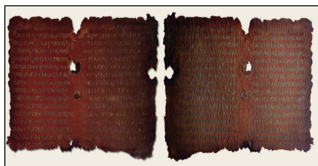
Ο πορφύρος κώδικας Βερατίου του 6ου αιώνα, γραμμένος με ασημένια γράμματα