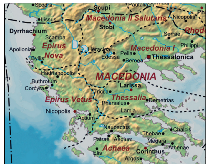
Ρωμαϊκές επαρχίες τον 4ο αιώνα μ. Χ.