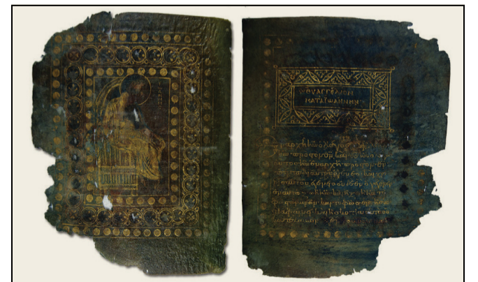
Ο κώδικας Βερατίου του 9ου αιώνα, με χρυσά γράμματα σε περγαμνή μπλε χρώματος