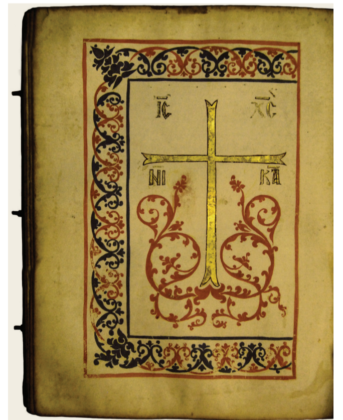
Κώδικας 10 Αυλώνας. Περγαμνή, 14ος αιώνας