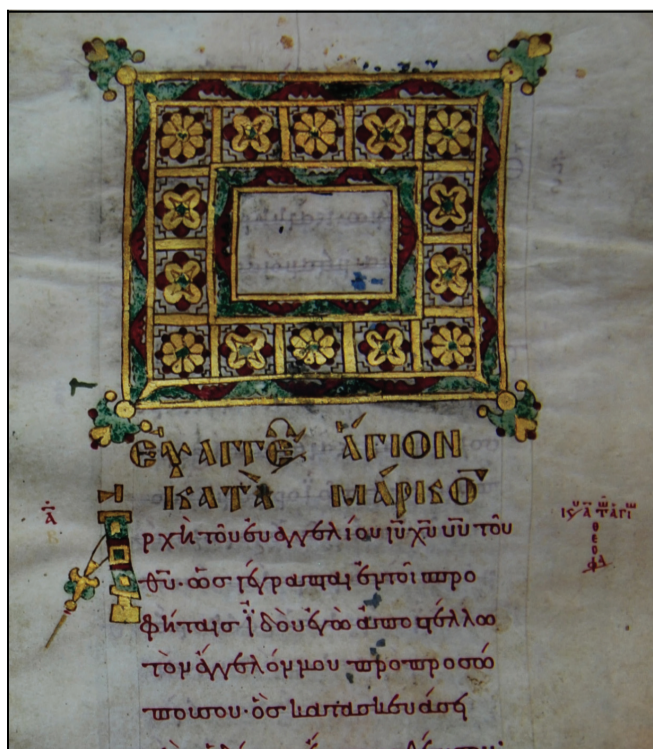
Κώδικας 92 Κορυτσάς. φ.130r . Περγαμνή, 10-11ος αιώνας